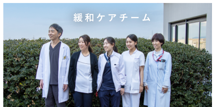
左から医師・看護師・リハビリスタッフ・栄養士・ソーシャルワーカー

個々の患者さんについてチームで様々な問題点を相談しながら最善の緩和ケアを提供できるように取り組んでいます。